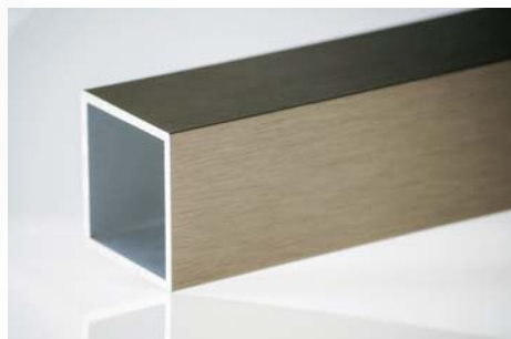
P03 imitace nerez

Tmavší povrch hliníku v imitaci nerez, hrubé kartáčování.