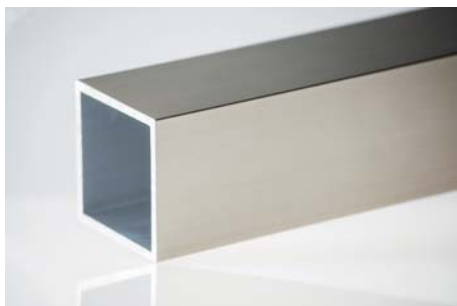
P03s imitace nerez světlá

Světlejší povrch hliníku v imitaci nerez, jemné kartáčování.